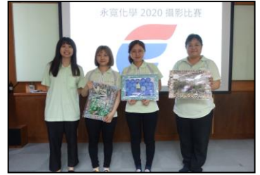
四月-举办以永宽为主题的摄影比赛，增加同仁彼此的互动。