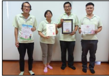
六月-2019 风云人物捐款慈善机构，让需要的人得到帮助。