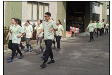
十月-全厂疏散演练，加强对逃生路线的印象和熟悉度。