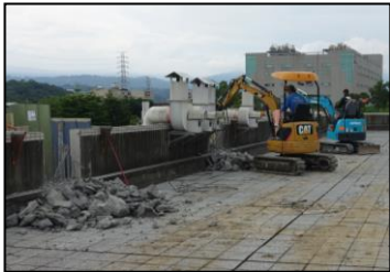
七月-随着作业空间的需求量增加，二厂四楼进行扩建工程。