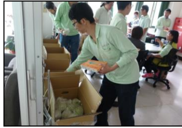
三月-支持台湾本土农业，购入多箱番石榴与全体同仁分享。