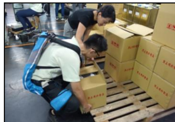
十一月-添购外骨骼肌力服，减少腰部伤害，降低身体劳损。