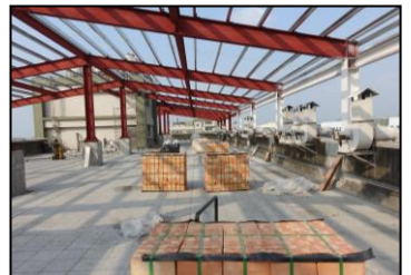
十二月-扩建工程进行钢架安装，期待完工的新面貌。