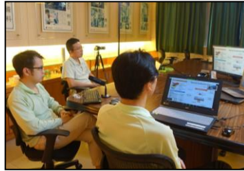
六月-首次参与在线产品发表会，在线观看达百人以上。