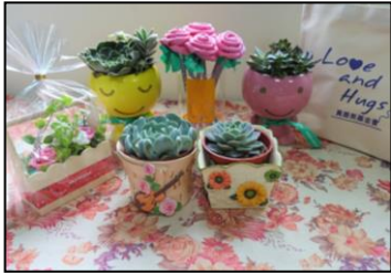
五月-组团购买公益礼品，可爱小物由心智障碍者亲自主作。