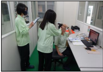
一月-防疫措施实行，每天进行体温测量，以保障同仁安全。

回顾 2020 年，疫情让人们无法出国、出门要佩戴口罩、公共场所需保持社交距离...等。这些未曾有过的骤变和挑战，让我们更加珍惜眼前的一切。许多经济活动受到影响，却也突显出永宽的特点：产品拥有多元领域，高比例的客制化，加上研发的长期耕耘，我们仍然打出漂亮的一仗，业绩达到年度的理想目标。我们能够持续的茁壮成长，要感谢永宽同仁的努力，更要感谢大家的支持与鼓励。在此我们精选出 2020 年身边的大小事，与您一起记录这个特殊的年代。