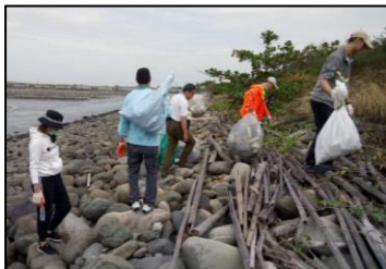
十月-举办净滩活动，清理海岸线的垃圾，使环境干净许多。