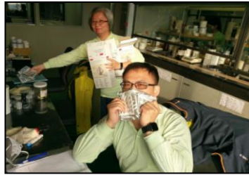
二月-因应口罩短缺，全厂限量供应，使资源能妥善分配。