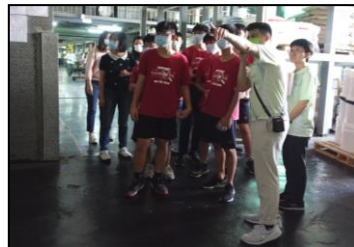
十一月-斗六高中来参访，动手动脑的学习内容，体验新知。