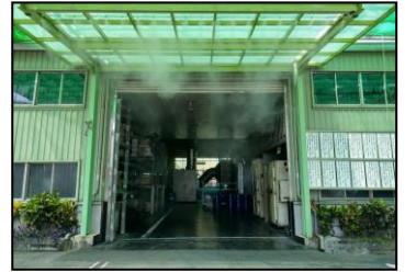
七月-增设降温的造雾机，在夏天作业时，也能有舒服环境。