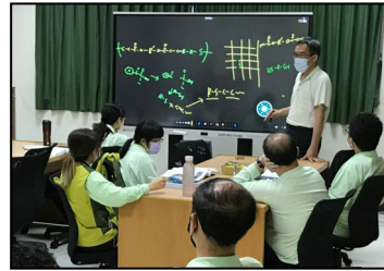
二月- 每月兩堂的研發部讀書會，分享經驗與專業知識。