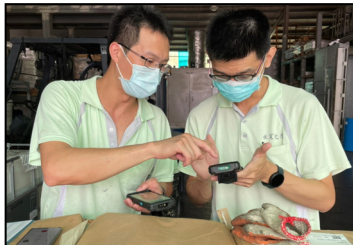
六月- 原料庫存盤點，使用電子化 PDA 操作，提高效率。