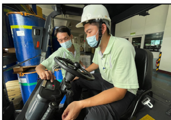
九月- 新進倉管員技能評估，把關操作流程及保障安全。