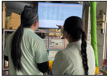
二月- 智能物流上線，運用電子顯示看板，資訊更即時。