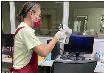
六月- 疫情期間，重視同仁健康，每日消毒、供給防疫茶。