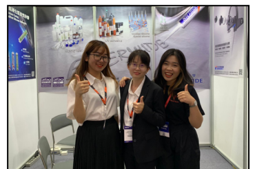
九月- 越南國際電子製造關連展，感謝各界好友相挺參與。