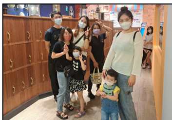
八月- 參訪塔吉特觀光工廠，手作個人蛋糕，親子樂無窮。