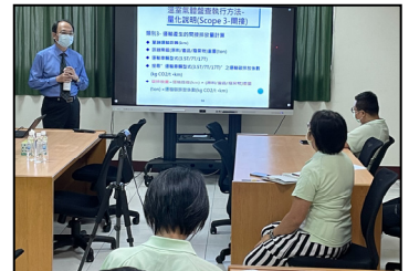
五月- ISO 14064 顧問輔導，對溫室氣體排放量進行盤查。