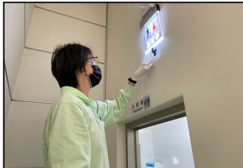
三月- 廁所使用中能感應亮燈的自動裝置，提升如廁禮儀。