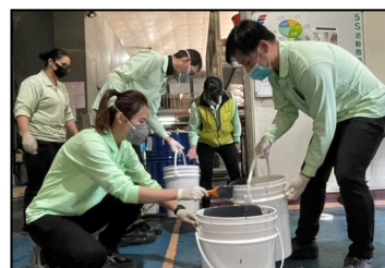
十二月- 同仁不分部門，重新鋪設二廠一樓的地板漆面。