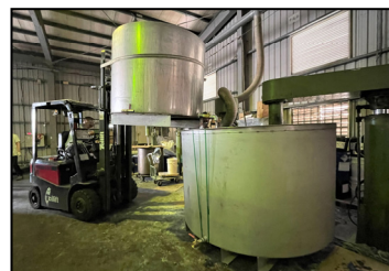
九月- 增加單次生產量，訂製了三噸桶，創造效能和產能。