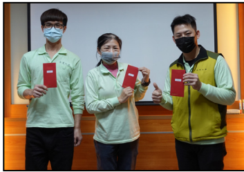
一月- Everbonder 的 B2C 產品攝影競賽，恭喜獲獎同仁。

2023 來臨之際，回顧 2022，大家有哪些難忘的事情？對未來又會有什麼期盼？2022 年我們嘗試許多新事物：多元學習方式、交流內隱知識、e 化資訊流通、豐富員工生活、行動支持公益等。感謝客戶及讀者朋友們的支持，是我們成長的一大動力。今年度最後生產日 1 月 13 日(星期五)、最後出貨日為 1 月 16 日(星期一)。1 月 20 日~1 月 29 日是 10 天的春節假期，我們將於 1 月 30 日(星期一)正式上班。請您繼續關注我們的官網、臉書等最新動態，雙週報於 2 月 6 日與您歡樂相見。兔年來到，祝您鴻兔大展、吉星高照。