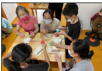
十月- 海口生活館，刻印創意印章，開發手腦的協調能力。