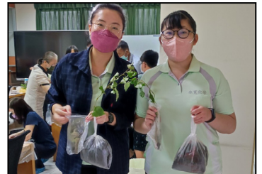
七月- 養生藥草體驗活動，領取植物苗還可在家自行植栽。