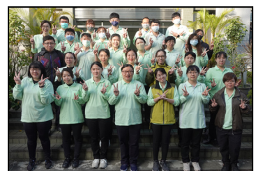
十二月- 2022 年新進的同仁合照，歡迎您加入永寬大家庭。