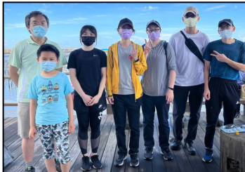
四月- 連續五年第八次淨灘。參與同仁獲得美味公益禮品。