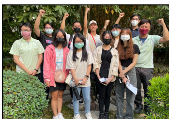
十一月- 協助中原大學、雲科大學生，完成學期成果報告。