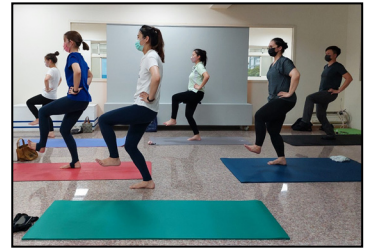
三月- 展開為期七個月的瑜珈課程，活絡筋骨、練習專注。