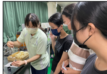
七月- 高中生來廠，撰寫學習履歷報告，教學黏度劑儀器。