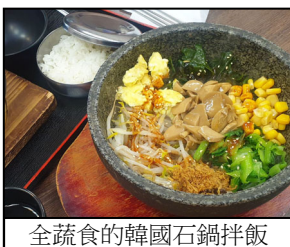
全蔬食的韓國石鍋拌飯