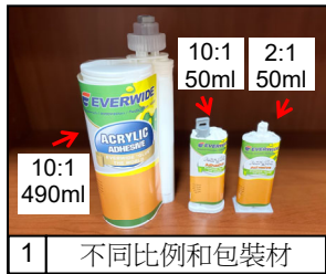
1 不同比例和包裝材