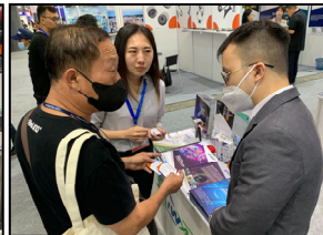
3 相互認識，交換名片