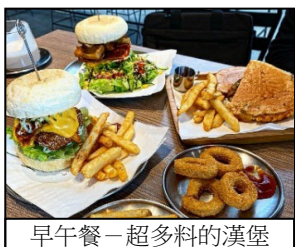
早午餐一超多料的漢堡