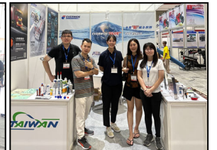
5 參與同仁與當地經銷商

5 月 24~26 日我們參加了在雅加達舉辦的印尼國際汽車零配件展。這個展覽是東南亞最大的相關展覽，汽車零配件售後服務是它關注的焦點。在這 3 天的展期間，吸引約 25,000 名人士觀展。印尼都市化帶動電動機車需求，我們把重點放在相關零配件上，所使用的接著劑 (圖 1~3)。我們的攤位收到相當的好評，第一次就有這樣的成果大家都很高興，相約下次還要來 (圖 4,5)。