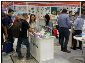
2 來攤位了解與詢問