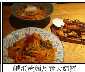
鹹蛋黃麵及素天婦羅