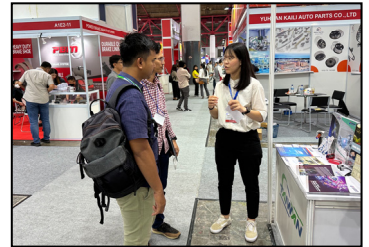
五月- 印尼國際汽車零配件展，了解行業趨勢和提高知名度。