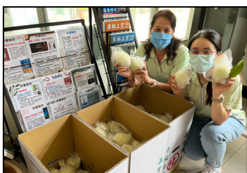
十一月- 支持本地小農，美味的芭樂與同仁們一起分享。