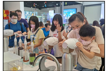
七月- 參觀冷研碳索館，透過手作實驗，學習二氧化碳知識。