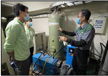
一月- 新增空壓機設備，廠商講解教學，同仁認真學習。

2023 年各行各業都受到衝擊，但我們積極迎接挑戰。在過去一年裡，我們參加了許多亞洲國家的展覽，以拓展市場知名度；進行了多項廠區擴建，提高生產效率；建構知識管理系統，有效地管理和運用內部資源；實施人員能力考核制度，促使人員不斷進步。感謝您的支持與信任，我們會繼續努力，提供更優質的產品和服務，以滿足您的需求。今年最後生產日 2 月 1 日、最後出貨日為 2 月 2 日。2 月 8 日~2 月 14 日是春節假期，我們將於 2 月 15 日上班。雙週報於 2 月 26 日與您相見。祝您龍騰虎躍、萬事如意！