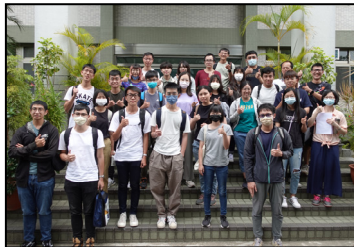
六月- 中山大學參訪，了解廠區環境、生產設備和製造流程。