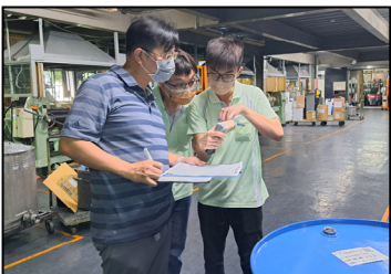
八月- 通過 IATF16949 換證複評，維持良好品質管理系統。