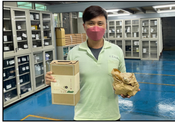
一月- 支持原住民農創，購買香菇禮盒，與伙伴們分享。