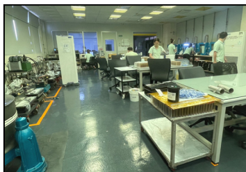
九月- 小批量生產線，擴建作業空間，讓生產效率提升。