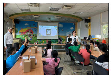
十二月- 「永寬 FUN 魔法」，把有趣科學知識帶入校園。