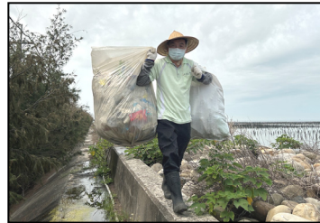
四月- 淨灘活動，我們用實際行動，為海洋環境盡一份心力。