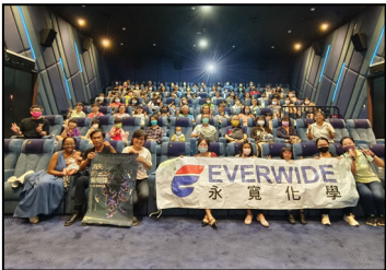
六月- 觀看國片《消失的紫斑蝶》，提倡生態保育觀念。