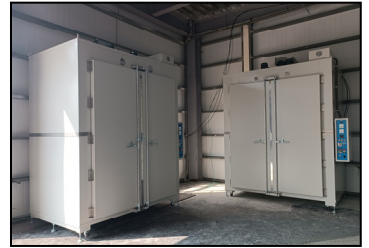
二月- 為提升生產效率和品質，引進多台大型烘箱。