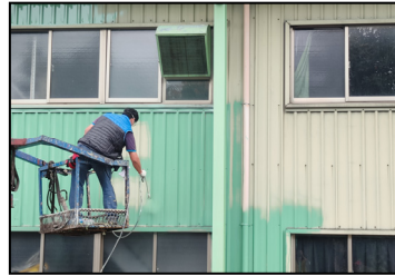
二月- 廠區的鐵皮外牆，進行噴漆，讓外觀更明亮整潔。