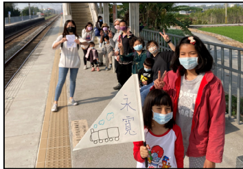
三月- 親子省碳小旅行，讓孩子體驗搭乘大眾運輸工具。