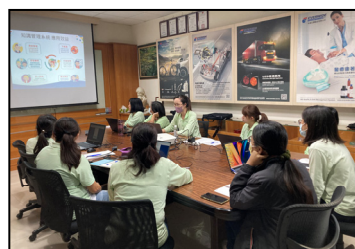
十二月- KM 知識管理平台，進行功能介紹和討論交流。