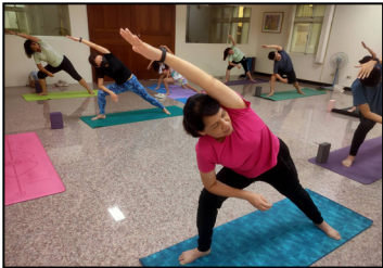
三月- 舉辦為期半年的有氧瑜珈，促進員工的身心健康。