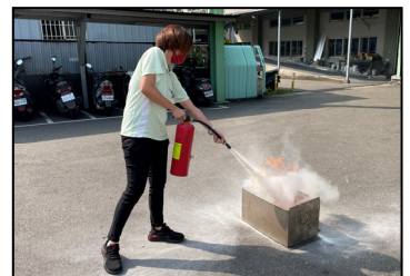
十月- 消防暨毒化物綜合演練，增加事故處理的能力。