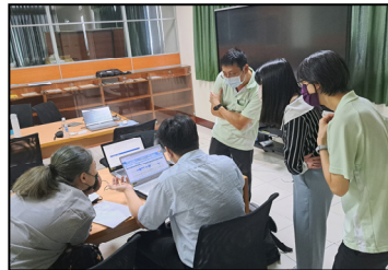
七月- ISO14064-1 溫室氣體盤查，達到相關的排放標準。