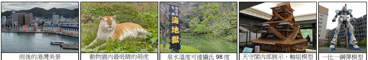
雨後的港灣美景 動物園內最吸睛的萌虎 泉水溫度可達攝氏 98 度 天守閣內部展示，軸組模型 一比一鋼彈模型